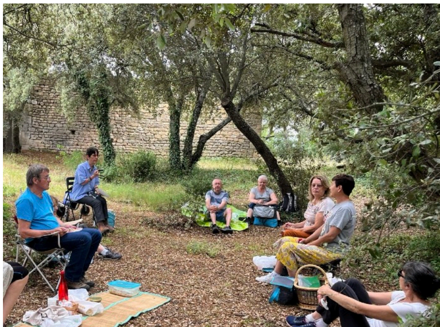
Pique-nique à Saint-Jean le 9 Juin - ©Nicole Llobère

Contact: assoava@wanadoo.fr Site et blog: amisduvieilalleins.com