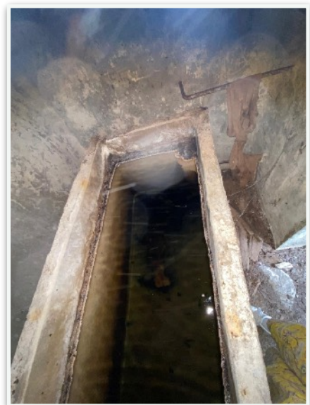
En face de Saint-Martin, un édifice aux proportions insolites abrite un bassin.

Nous avons contacté l'association des Amis d'Aurons pour la visite de Saint-Martin: très bon contact, ils nous ont fait visiter la chapelle et offert un apéritif . Là encore des manifestations à envisager ensemble, en particulier un concert à Saint-Martin au printemps prochain.