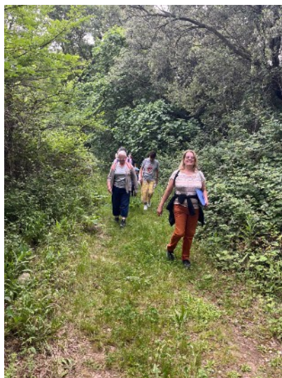
D'une chapelle à l'autre