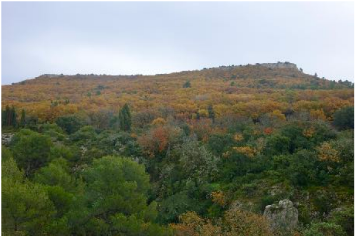
Automne 2023 dans la colline

Contact: assoava@wanadoo.fr Site de l'AVA: www.alleins.net/info